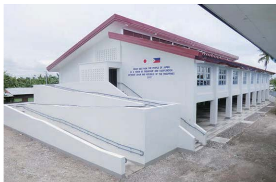
台風ヨランダ災害復旧・復興 (フィリピン) SanRpque小学校