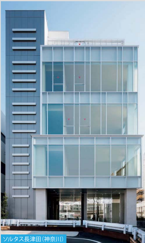
ソルタス長津田 (神奈川)