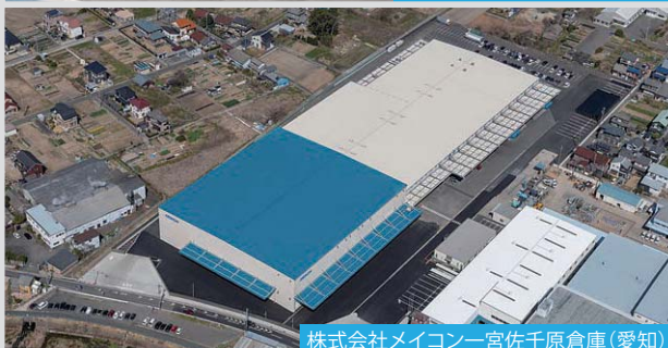
株式会社メイコンー宮佐千原倉庫 (愛知)