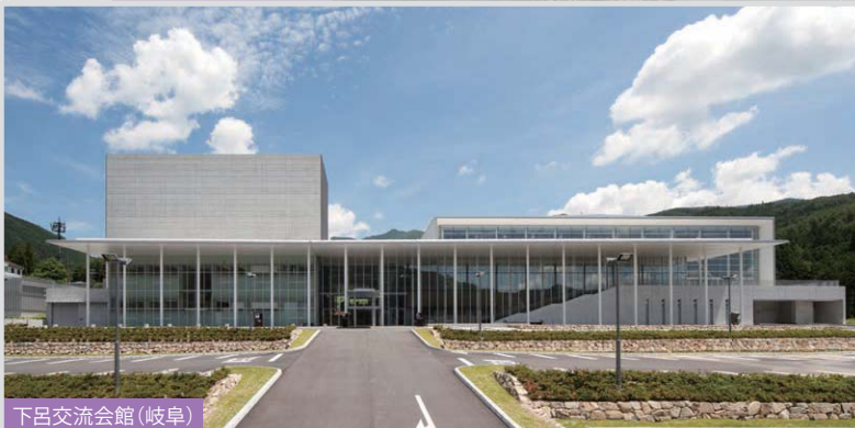
下呂交流会館(岐阜)