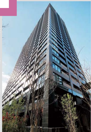
プレサンスレジェンド 堺筋本町タワー (大阪)