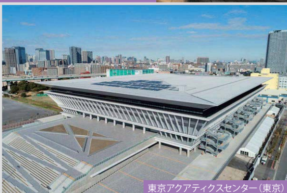
東京アクアティクスセンター(東京)