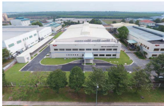
ムロテックベトナム第2工場建設工事 (ベトナム)