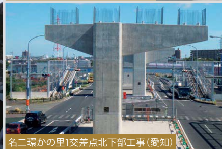
名二環かの里1交差点北下部工事(愛知)