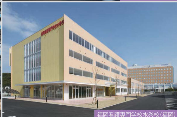
福岡看護専門学校水巻校(福岡)