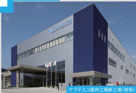
ナブテスコ垂井工場新工場 (岐阜)