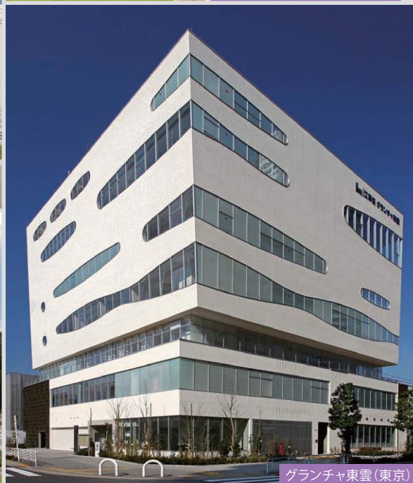
グランチャ東雲(東京)