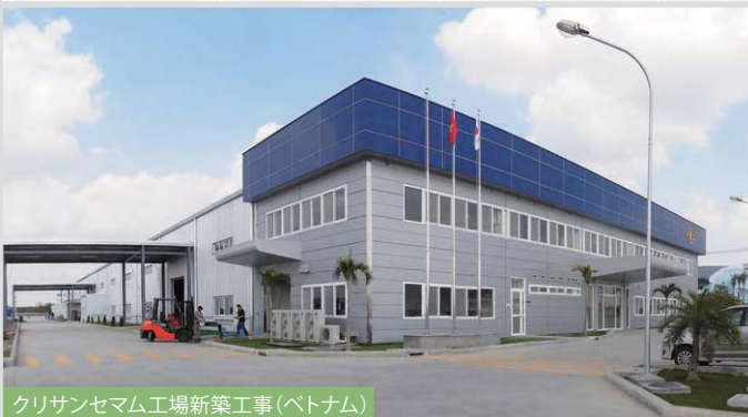
クリサンセマム工場新築工事 (ベトナム)