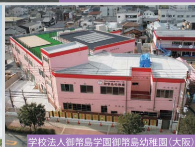
学校法人御幣島学園御幣島幼稚園(大阪)