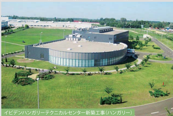
イビデンハンガリーテクニカルセンター新築工事 (ハンガリー)