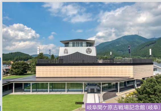
岐阜関ヶ原古戦場記念館(岐阜)