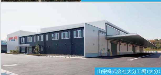
山宗株式会社大分工場 (大分)