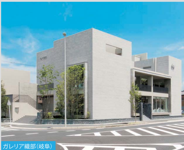
ガレリア織部 (岐阜)