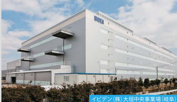
イビデン(株)大垣中央事業場 (岐阜)