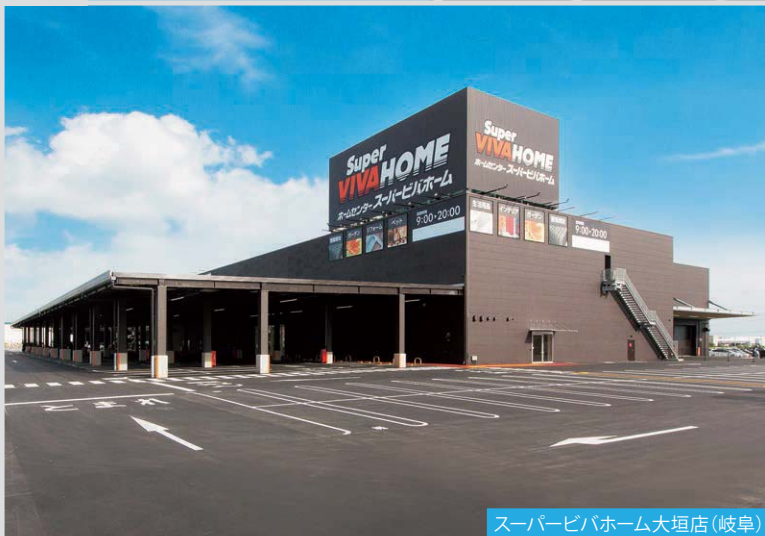
スーパービバホーム大垣店 (岐阜)