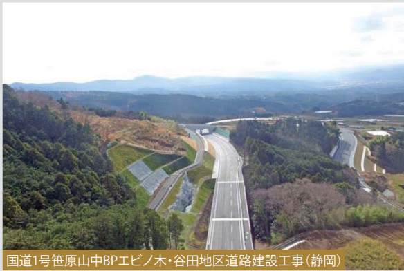
国道1号笹原山中BPエビノ木・谷田地区道路建設工事(静岡)