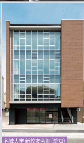
名城大学 新校友会館(愛知)