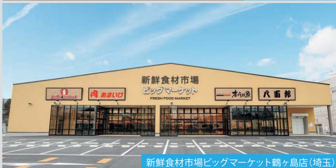
新鮮食材市場ビッグマーケット鶴ヶ島店 (埼玉)