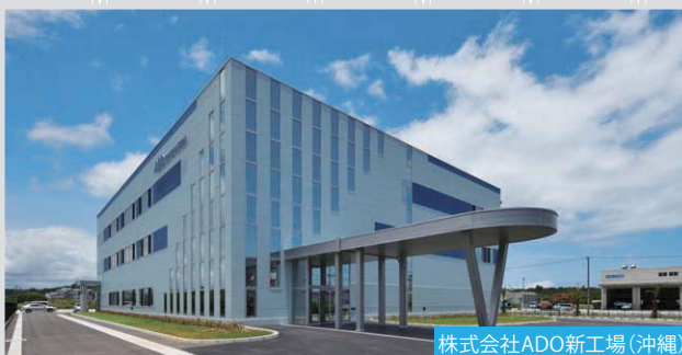
株式会社ADO新工場 (沖縄)