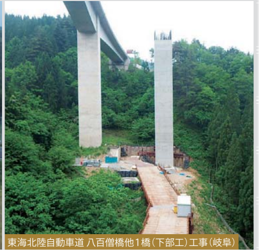
東海北陸自動車道 八百僧橋他1橋(下部工)工事(岐阜)