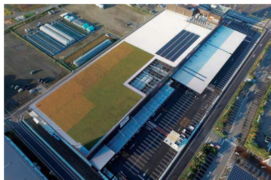
スーパービバホーム大垣店屋上緑化・太陽光発電