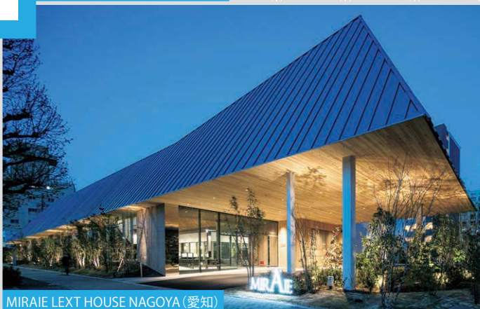
MIRAIE LEXT HOUSE NAGOYA (愛知)