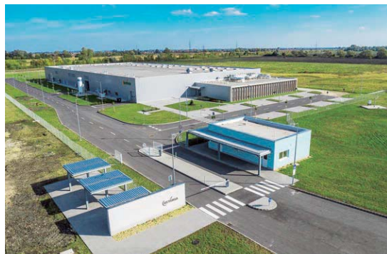
GS YUASA ハンガリー工場新築工事 (ハンガリー)

TSUCHIYAでは、日本企業が海外で事業を行う際、安心して建物を建設できるよう、トータルサポートを徹底して行っています。弊社が厳選した海外現地法人のパートナーと、現地駐在のTSUCHIYA職員が全面的にフォローすることで、日本で建設する際と変わらぬサポート体制を実現しています。会社設立の現地市場調査、コスト調整、品質・工程管理、契約のお手伝いなど、業務全般のトータルサポートにより、さらなる顧客満足度の向上に努めています。