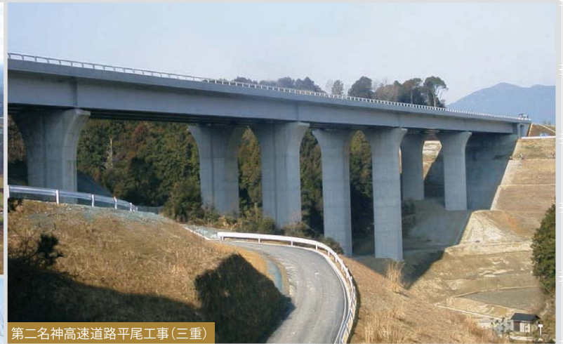
第二名神高速道路平尾工事(三重)