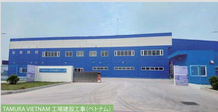
TAMURA VIETNAM 工場建設工事 (ベトナム)