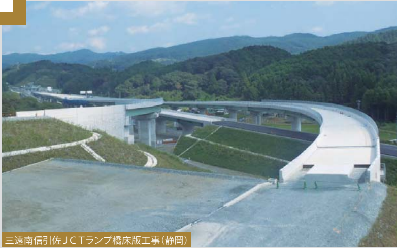
三遠南信引佐JCTランプ橋床版工事(静岡)