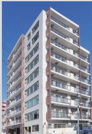
フランス澁川パークフロント (北海道)