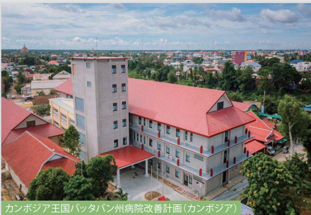
カンボジア王国バッタバン州病院改善計画(カンボジア)