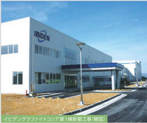
イビデングラフィイトコア第1棟新築工事(韓国)