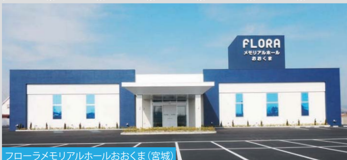
フローラメモリアルホールおおくま (宮城)