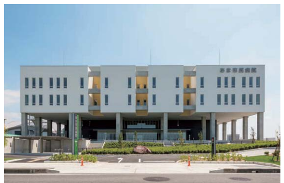
あま市民病院(愛知)