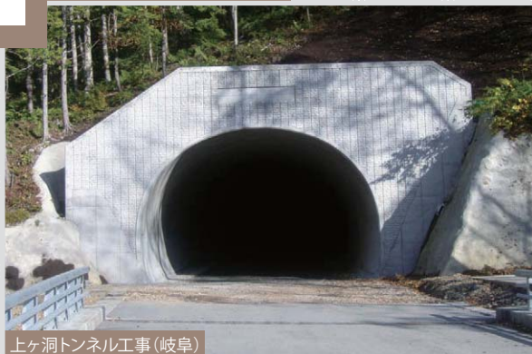
上ヶ洞トンネル工事(岐阜)