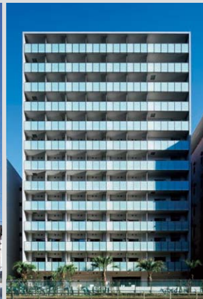
パークヒビオ芝浦 (東京)