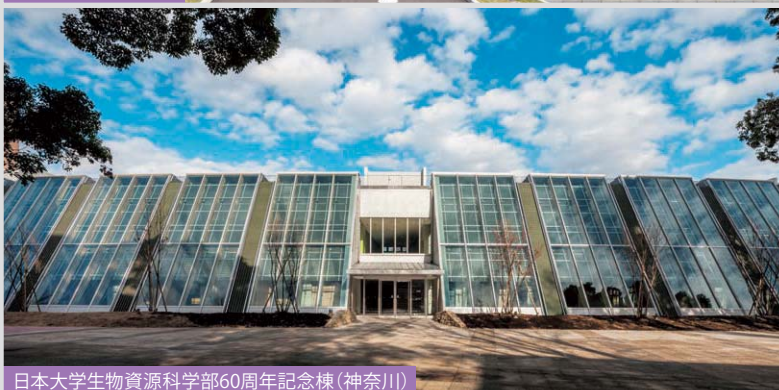
日本大学生物資源科学部60周年記念棟(神奈川)