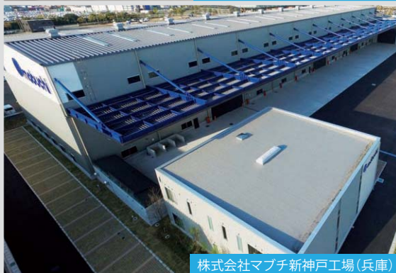
株式会社マブチ新神戸工場 (兵庫)