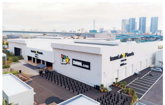
チームラボ プラネット TOKYO DMM.com(東京)