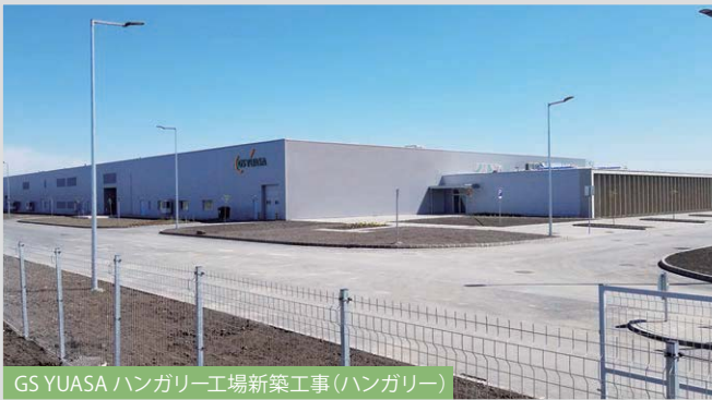
GS YUASA ハンガリー工場新築工事 (ハンガリー)