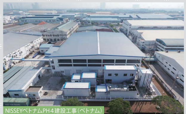
NISSEYベトナムPH4建設工事 (ベトナム)