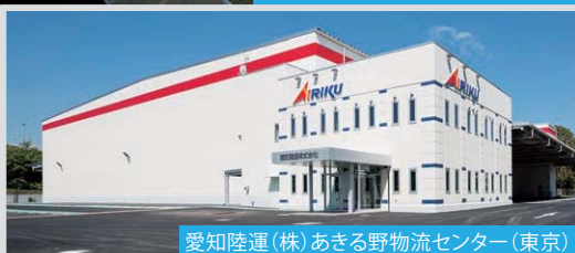
愛知陸運(株)あきる野物流センター (東京)