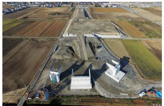
東海環状大野神戸IC(岐阜)

強い責任感と誠実さで信頼を得ているTSUCHIYAの職員が、専門家の立場から適切なアドバイスと迅速な対応でサポートします。医療福祉施設、教育文化施設、共同住宅、商業施設、工場、その他耐震工事を中心に、設計から施工、修繕工事までお客様の多様なニーズにあった商品を提供します。