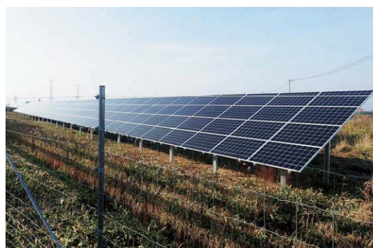
東部開発株式会社根室ハマテラスソーラー発電所