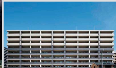
トラストネクサス木町ウイングレジデンス (福岡)