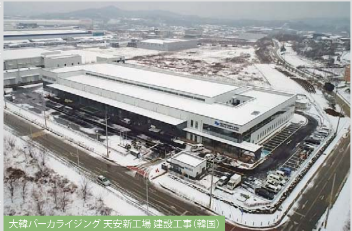
大韓パーカライジング 天安新工場 建設工事(韓国)