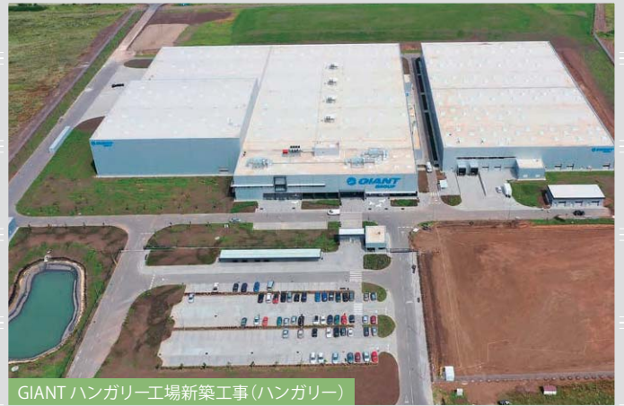
GIANT ハンガリー工場新築工事 (ハンガリー)