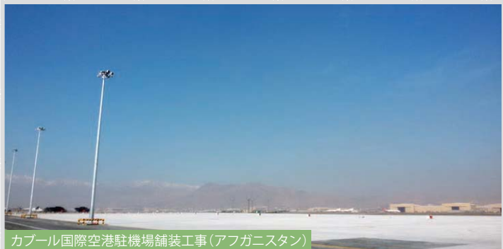
カブール国際空港駐機場舗装工事(アフガニスタン)