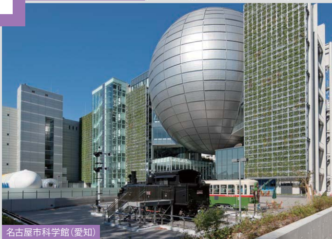
名古屋市科学館(愛知)