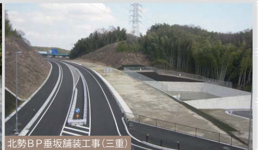
北勢BP垂坂舗装工事(三重)