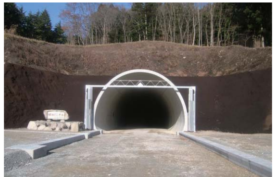
相谷トンネル(岐阜)