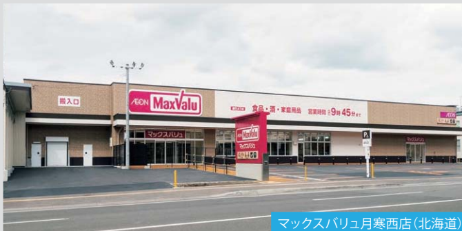
マックスバリュ月寒西店 (北海道)