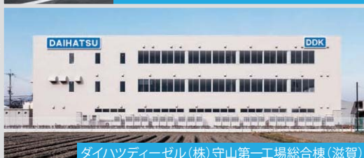
ダイハツディーセル(株)守山第一工場総合棟 (滋賀)