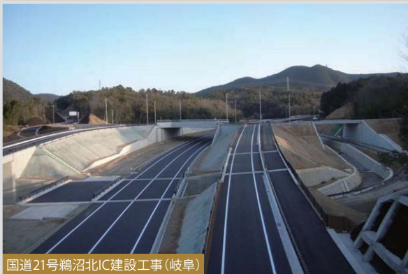
国道21号鵜沼北IC建設工事(岐阜)