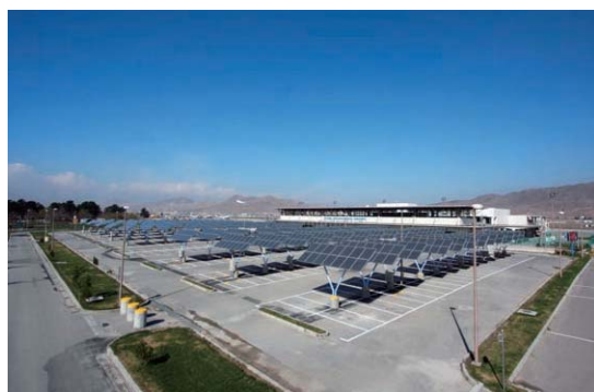
アフガニスタンカプール太陽光