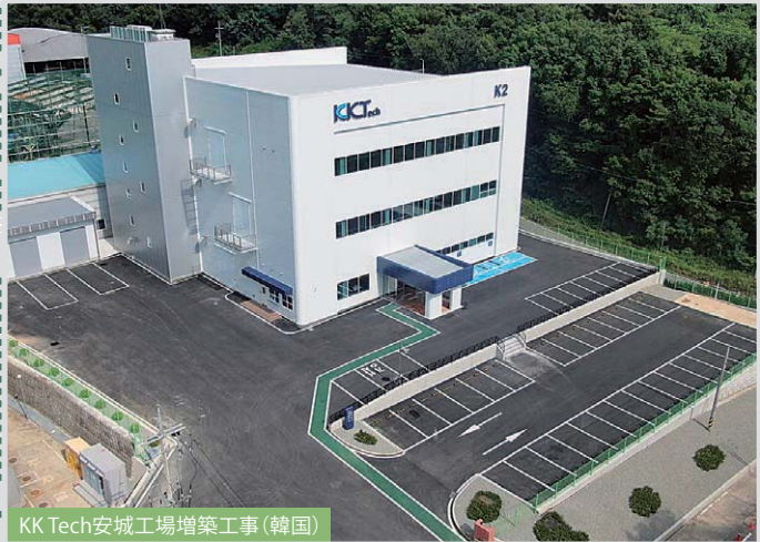
KK Tech安城工場増築工事(韓国)