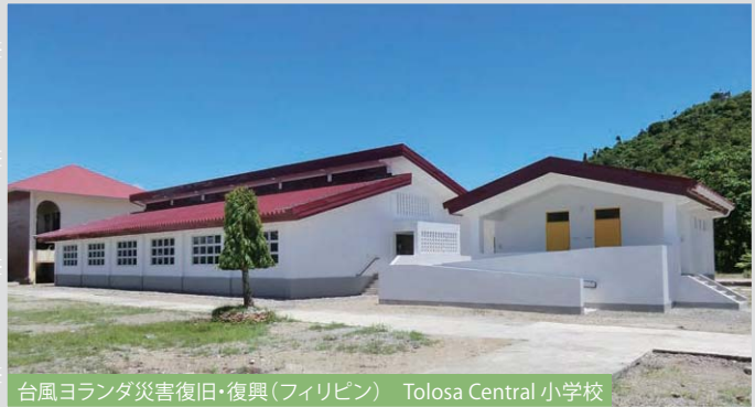
台風ヨランダ災害復旧・復興(フィリピン) Tolosa Central 小学校